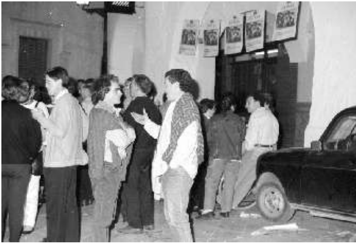
Acte de l'EEM a Ciutadella. Autor: Joan Capó Florit. Font: Arxiu d'Imatge i So de Menorca-CIM